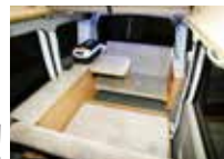
ダイネット(対座、テーブル使用時)

〔ベース車両〕 SUZUKI エブリー 軽自動車 AT車 ナビ・ETC・バックモニター