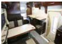
ダイネット&2段ベッド(後部)