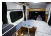
ダイネット(テーブル使用時)

〔ベース車両〕 NISSAN NT100クリッパ 軽自動車 AT車 ナビ・ETC・バックモニター