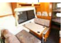
ダイネットスペース・2段ベッド